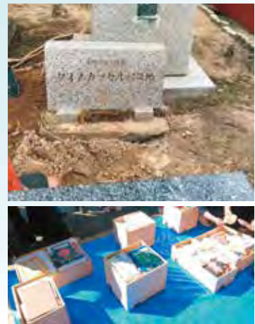
同窓会会長へ、採掘したタイムカプセルを贈呈しました。